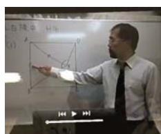
上は iPad 上の算数解説授業風景。